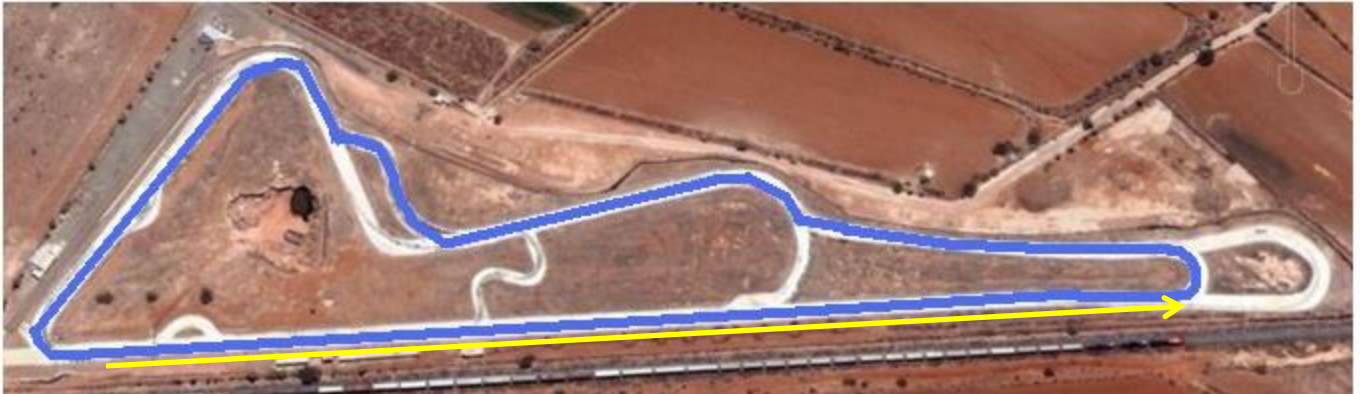
Vías del Ferrocarril